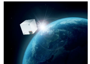
WITTENSTEIN-Technologie ist erfolgreich im All unterwegs

Die WITTENSTEIN SE entwickelt kundenspezifische Produkte, Systeme und Lösungen für hochdynamische Bewegung, präziseste Positionierung und intelligente Vernetzung in der mechatronischen Antriebstechnik.