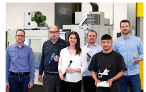
Übergabe der Prüfmittel in den Caritas-Werkstätten Alois Eckert in Lauda

Die WITTENSTEIN SE entwickelt kundenspezifische Produkte, Systeme und Lösungen für hochdynamische Bewegung, präziseste Positionierung und intelligente Vernetzung in der mechatronischen Antriebstechnik.