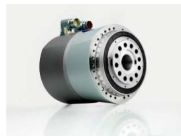
Das Galaxie® Antriebssystem von WITTENSTEIN: Weltneuheit und Gewinner des HERMES AWARD 2015