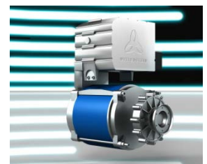
Zukunftsträchtig: hochkompaktes elektrisches Antriebssystem