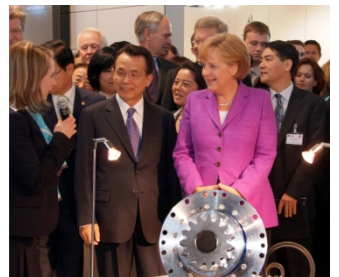
2009: Bundeskanzlerin Merkel auf dem WITTENSTEIN Messestand der Hannover Messe