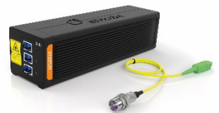
Optischer Sensor IDS3010 für Messungen im Nano-Bereich