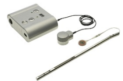
FITBONE® von WITTENSTEIN intens zur Knochenverlängerung im Menschen

Einsatzgebiete der Produkte aus den Unternehmensbereichen der WITTENSTEIN SE sind zum Beispiel Roboter, Werkzeug- und Verpackungsmaschinen, die Förder- und Verfahrenstechnik, Papier- und Druckmaschinen, die Medizintechnik sowie die Bühnen- und Hubtechnikbranche. Hinzu kommt die konsequente Entwicklung von Nischenmärkten wie der Luft- und Raumfahrt, der Antriebstechnik im und am Menschen, der Offshore-Erdgas- und Erdölförderung unter der Eisdecke des Nordmeeres oder der Nanotechnologie.