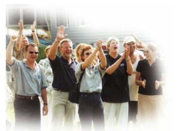
Heute wie damals: das wichtigste Kapital sind die Mitarbeiter