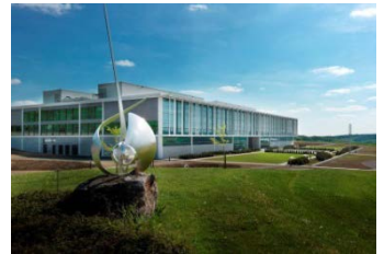
Offizielle Eröffnung im Mai 2014: Die WITTENSTEIN Innovationsfabrik in Igersheim-Harthausen.