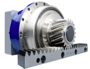
Servoaktuator TPM+ mit Ritzel-Zahnstange