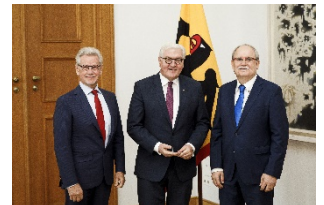
Das für den Deutschen Zukunftspreis 2018 nominierte Erfinderteam mit Bundespräsident Frank-Walter Steinmeier.