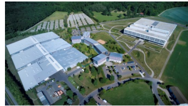
Firmensitz der WITTENSTEIN SE in Igersheim-Harthausen

1999 feiert die Unternehmensgruppe erneut Richtfest, in nur 3 Jahren wird die Fläche in Harthausen mehr als verdoppelt: es kommen das Entwicklungs- und Vertriebs- sowie Schulungs- und