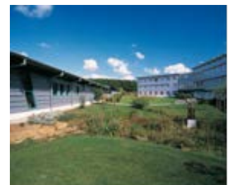
Weltgarten der WITTENSTEIN SE in Igersheim-Harthausen