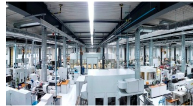
Blick in die neue „Urbane Produktion der Zukunft“ der WITTENSTEIN bastian GmbH in Fellbach