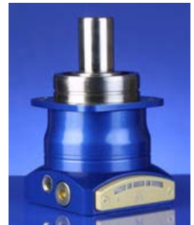
In den 90ern bereits die Vision – 2003 realisiert: das intelligente Getriebe alpha® IQ

Seit 29. September 2016 firmiert die bisherige WITTENSTEIN AG als WITTENSTEIN SE und wird damit als Europäische Aktiengesellschaft geführt.