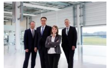
Vorstand der WITTENSTEIN SE